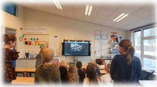
1 april ! in groep 4