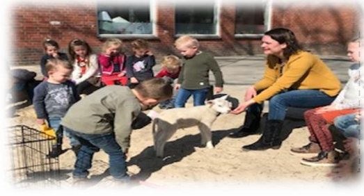
Lente in de Duizendpotengroep