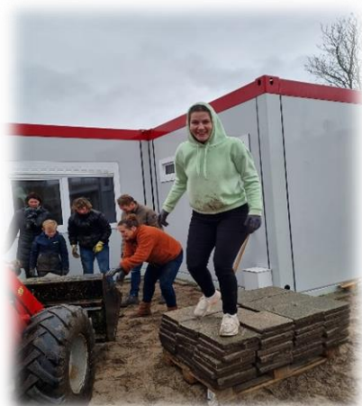
Zelfs juffen worden hier blij van!

We houden u op de hoogte van de vorderingen en anders neemt u zelf af en toe een kijkje.